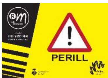
Cartell de perill

Informació específica de cada punt de pas i de control