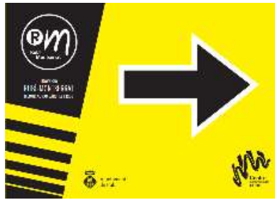
Cartells fletxa dreta