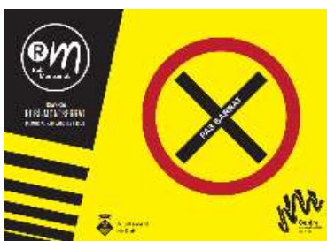
Cartell pas barrat