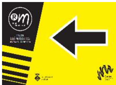
Cartells fletxa esquerra