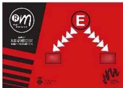
Cartells evacuació vermells: indiquen el sentit en què cal fer l'evacuació si s'escau