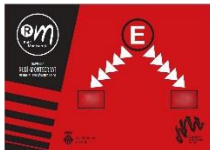
Cartells evacuació vermells: indiquen el sentit en què cal fer l'evacuació si s'escau