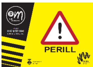
Cartell de perill

Informació específica de cada punt de pas i de control