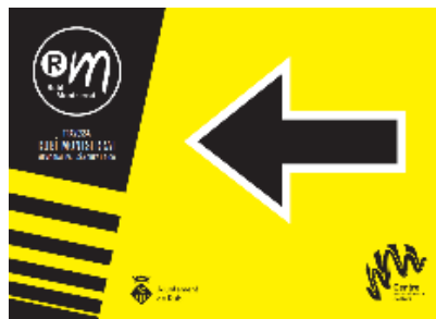
Cartells fletxa esquerra