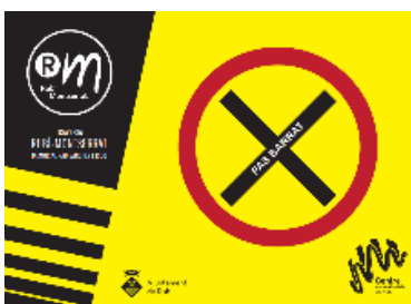
Cartell pas barrat