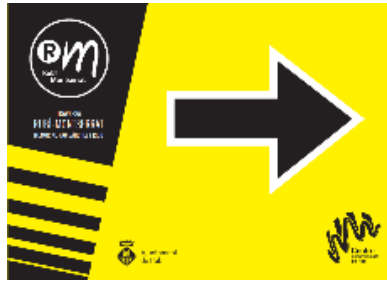
Cartells fletxa dreta